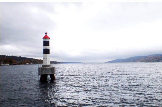
Litus Lux - Dagtid - På fundament i sjø