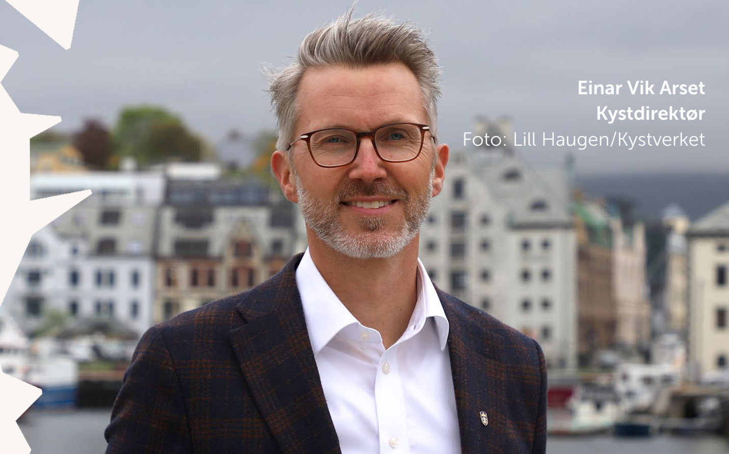
Einar Vik Arset Kystdirektør