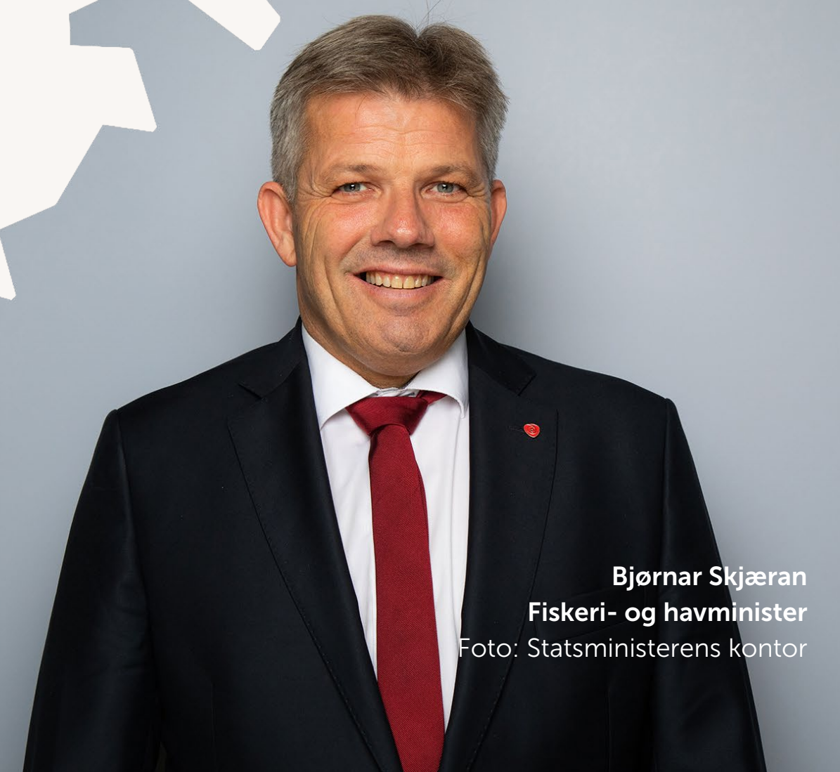
Bjørnar Skjæran Fiskeri- og havminister