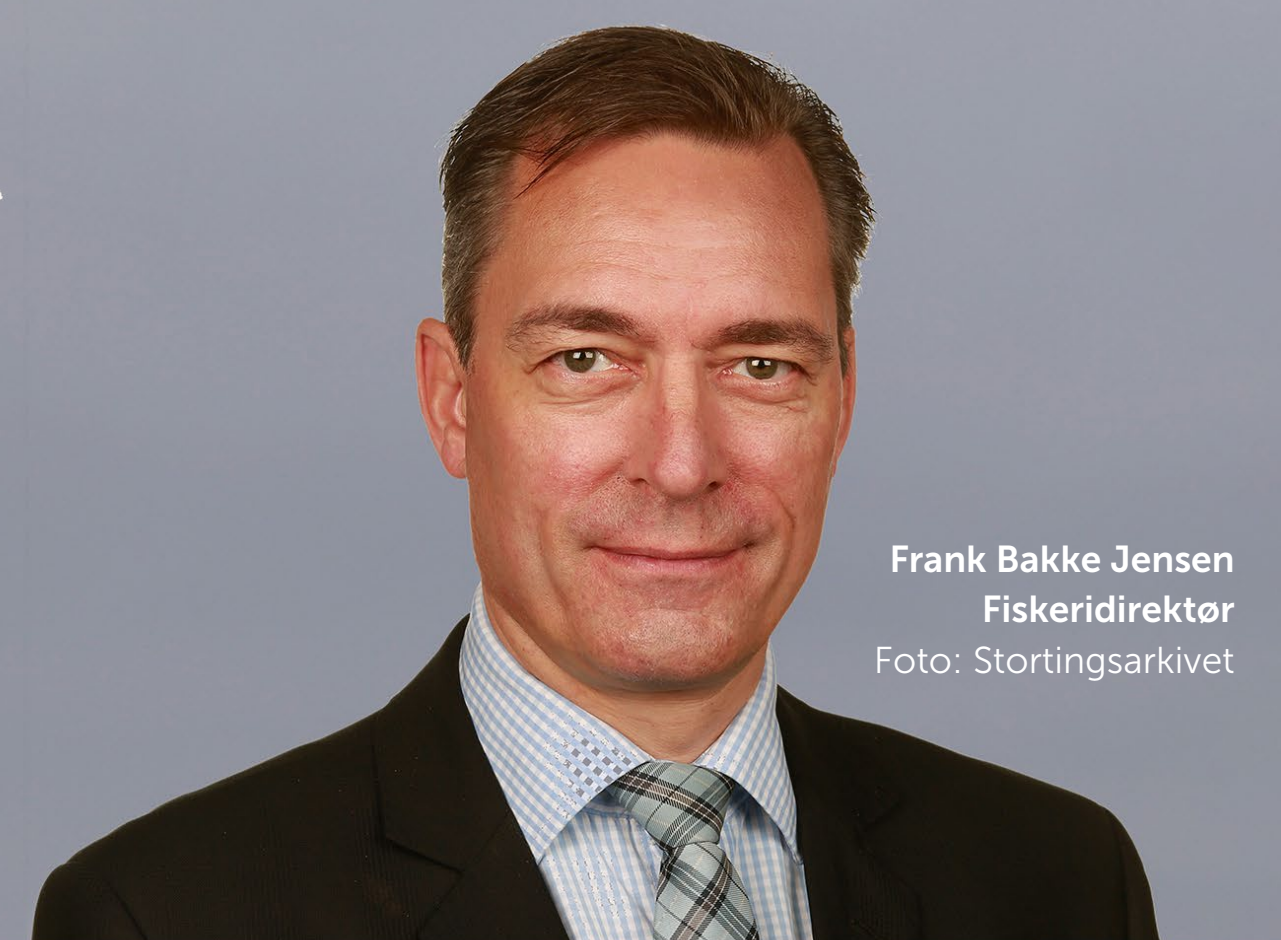
Frank Bakke Jensen Fiskeridirektør