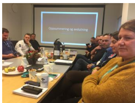
Alle viktige nøkkelpersoner var samlet under øvelsen i Stord hamn

Å kunne ha en kontaktperson som representerer alle havneanleggene på Stord i en situasjon med et generelt forhøyet trusselnivå var en av de viktige fordelene med havnesamarbeidet som lokalt politi trakk frem. Andre kommentarer fra møtet var at det var veldig interessant å høre de ulike aktørenes tanker om hvordan man tenker beredskap og sikring ved økt trusselnivå.