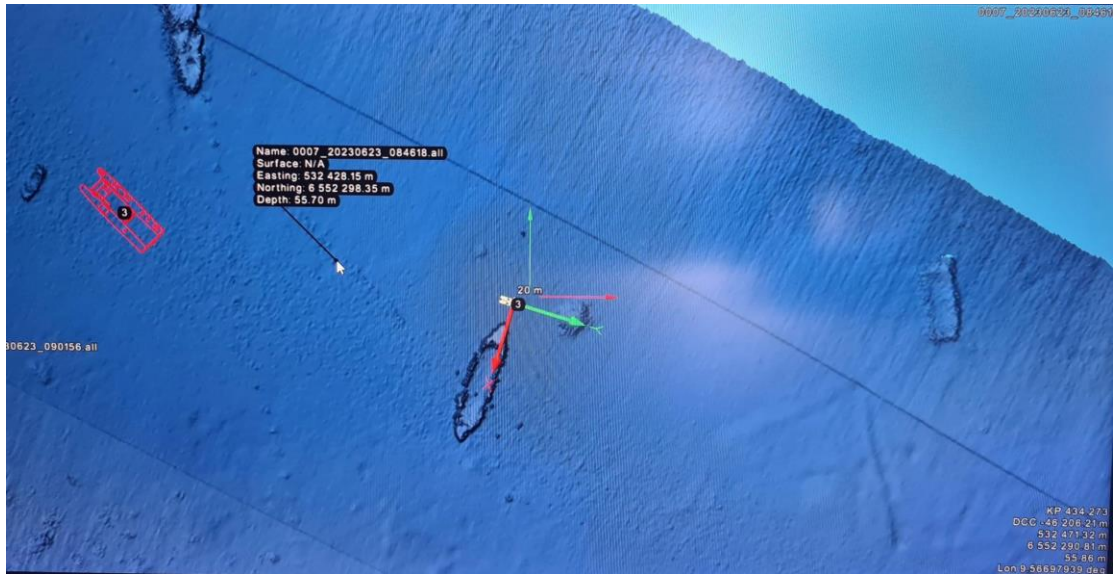
Fig 3 Skjerm bilde fra ROV inspeksjon. Underlagskartet er multibeam. Posisjonering av surveyfartøy (rødt) og ROV (hvit m grønn/rød pil). Vrak som sees i utsnittet er øverst til venstre en større stålboat/fraktefartøy, helt til venstre en ca. 20 f.t.. «kogg» / tresnekke, midt i bildet en kravellbygget trelekter, v/ grønn pil en lunse/stroppet tømmer og til høyre en kasseformet trelekter.

Kartleggingen med multibeam og ROV ble gjennomført på en dag. Etterarbeid besto av å konvertere posisjoner og legge disse inn i kulturminnebasen Askeladden. De av funnene som ligger inne i planområdet som var på høring er vist i figur 4.