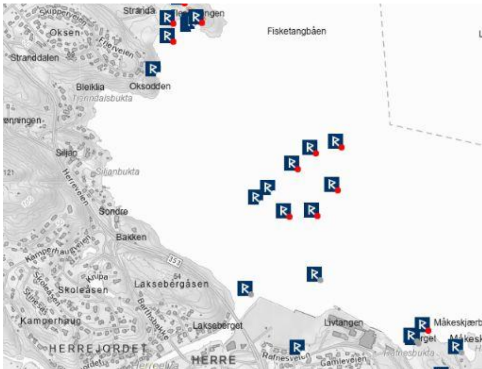
Fig 4. Lokalisering av registrerte båtfunn i planområdet. (utsnitt kulturminnebasen askeladden). Id 298899, 299018, 299389, 299005, 299386, 299393 er registrert som fredede.

Kartleggingen med multibeam og ROV ble gjennomført på en dag. Etterarbeid besto av å konvertere posisjoner og legge disse inn i kulturminnebasen Askeladden. De av funnene som ligger inne i planområdet som var på høring er vist i figur 4.